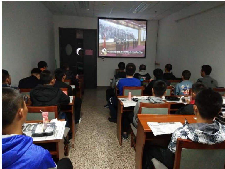
图为 航院师生集体收看新一届中共政治局常委见面会