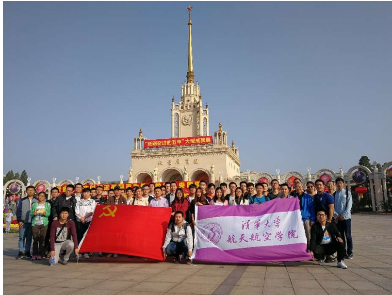
图为 航院师生在北京展览馆前合影留念

在参观展览的过程中，老师同学们首先随着讲解员参观了“践行新发展理念 引领经济发展新常态”、“坚定文化自信 创造中华文化新辉煌”等展厅，体会到了国家的综合国力和国际影响力再上新台阶，中国经济航船乘风破浪，向着全面建成小康社会胜利前进，也体会到了传承发展的中华优秀传统文化，大力弘扬的革命文化，师生们为社会主义先进文化感到自豪，感受到文化发展为实现中华民族伟大复兴的中国梦凝聚起的强大精神力量。