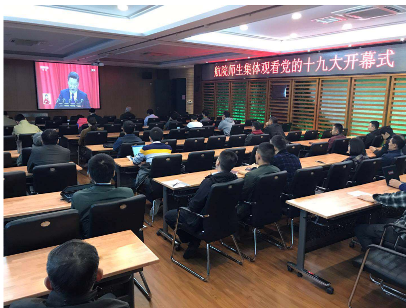
图为 航院师生收看党的十九大开幕会现场

这次大会是在全面建成小康社会决胜阶段、中国特色社会主义发展关键时期召开的一次十分重要的大会，十九大报告中的中国特色社会主义进入新时代、新时代中国特色社会主义思想、社会主要矛盾已经转化、确保党始终走在时代前列、把中国建成社会主义现代化强国等多个新提法、新亮点引起师生的强烈关注和热烈反响。直播后师生纷纷表示深受鼓舞、倍感振奋，要以更加饱满的工作热情、更加扎实细致的工作作风，切实做好各项工作。坚信在中国共产党的正确领导下，最终会全面建成小康社会，实现中华民族伟大复兴的中国梦。