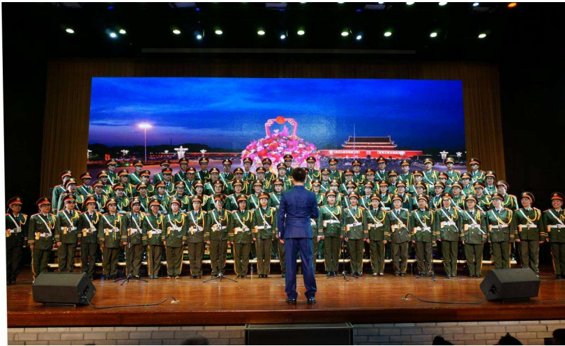
图为 航院、信研院、计算机系联队文艺汇演现场

本学期开学以来我院二十多位教师，与兄弟院系组成联队，利用午休时间，经过专业老师的训练，合唱水平大幅提高。10月18日正逢十九大胜利召开之日，参加合唱的教职工用大合唱的形式歌唱伟大的祖国，一曲《祖国不会忘记我》唱出了大家的心声，整场演出从演唱形式、服装道具都别具一格，受到评委及观众的一致好评。