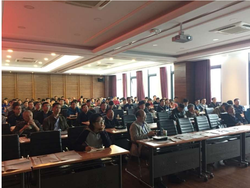
图为 航院师生集体收看新一届中共政治局常委见面会