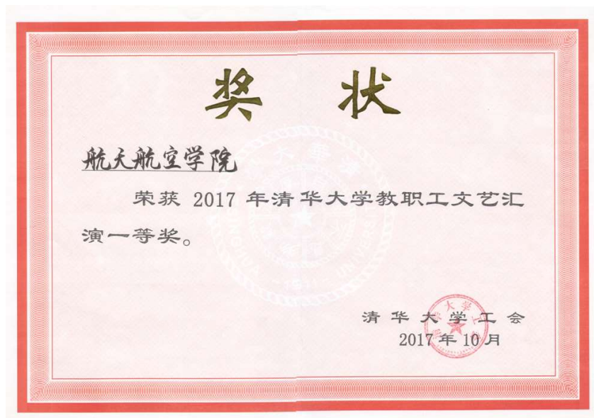
图为 文艺汇演奖状